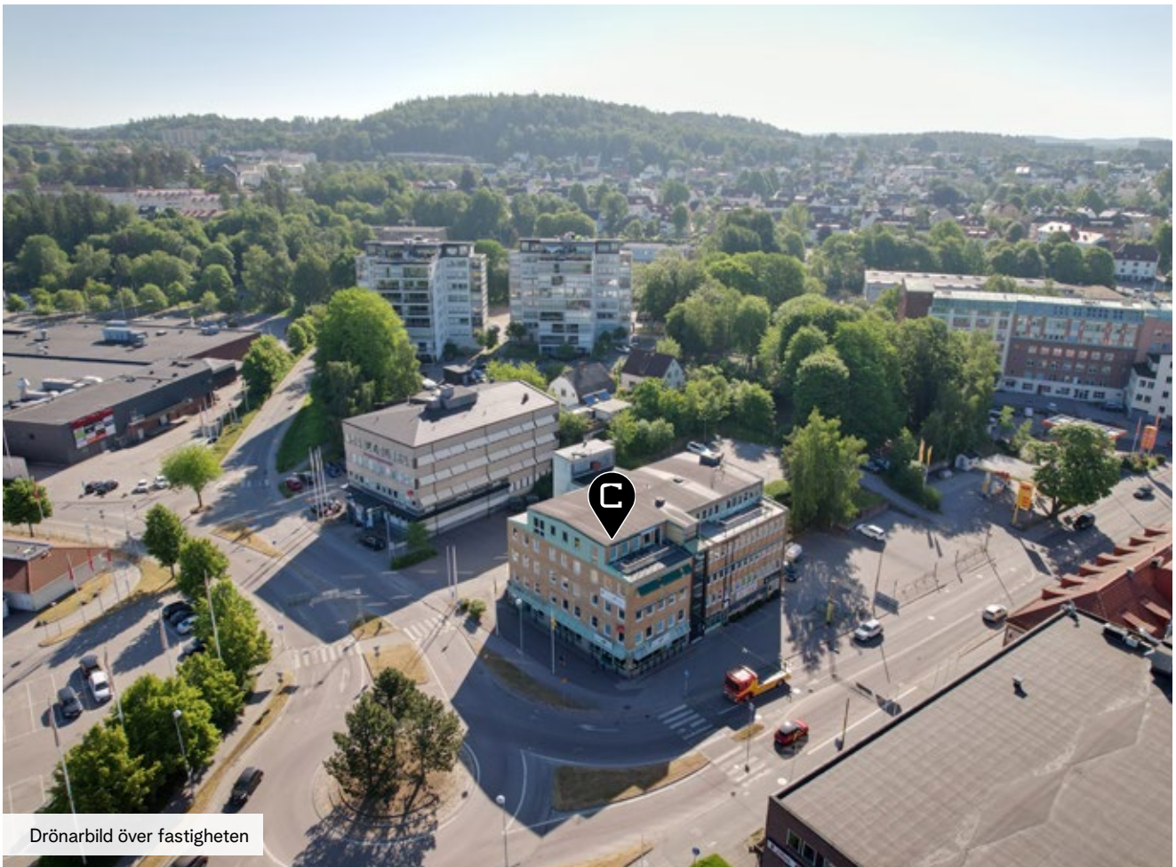
Drönbild över fastigheten