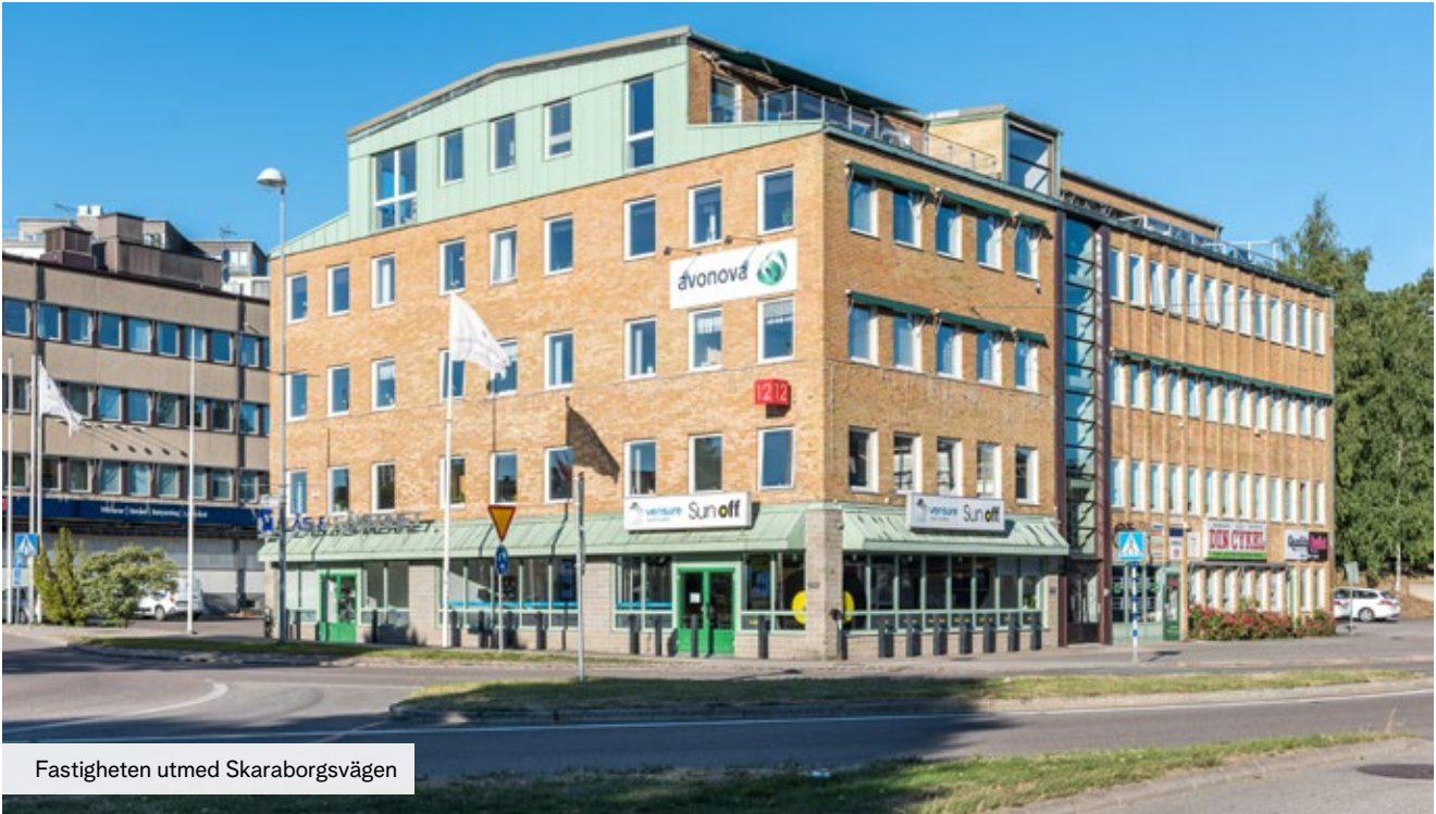
Fastigheten utmed Skarborgsvägen