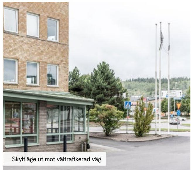
Skyltläge ut mot vältrafikerad väg